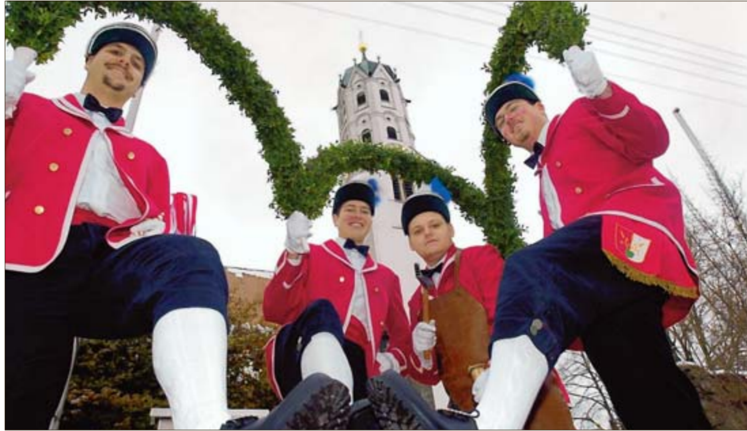
Ein schmuckes Bild geben die Dinkelscherber Schäfflertänzer ab, die ab Sonntag wieder in der Marktgemeinde Dinkelscherben auftreten.