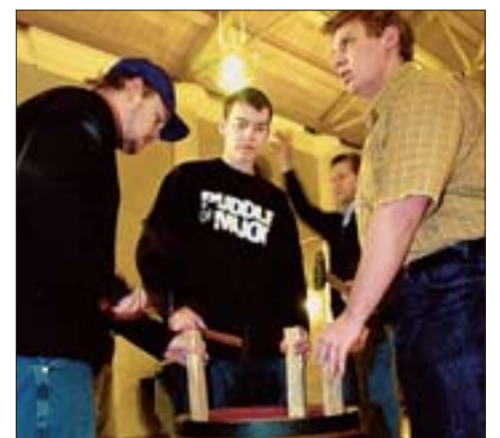
Die Fassschläger symbolisieren das Aufschlagen der Eisenreifen auf die Fassdauben und somit die Herkunft der Schäfflertänzer als Zunfittanz der Fassmacher.